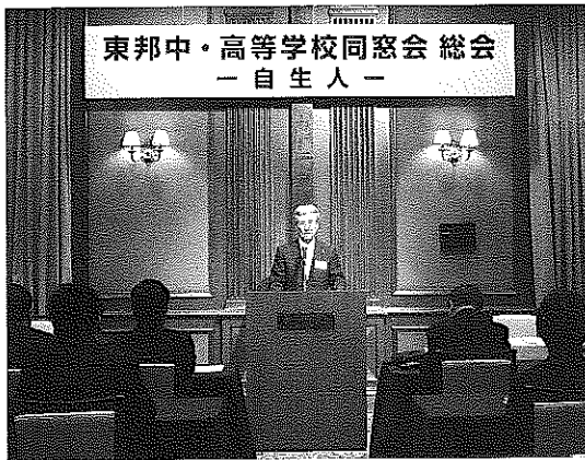
同窓会総会 平成23年6月

10年後に東邦高等学校が創立70年、東邦中学校が創立60年の周年記念を更に進化した姿で迎えられることを心よりご祈念申し上げます。