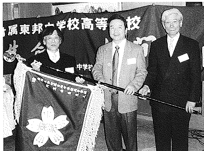
応援団旗贈呈 平成23年1月