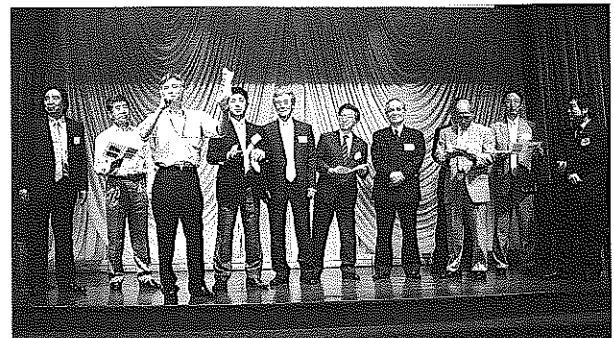
同窓会懇親会 平成23年6月